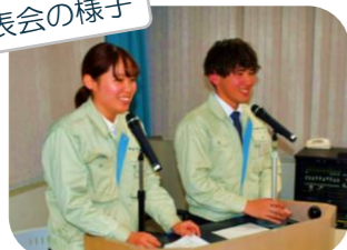
素敵な笑顔の司会のお二人♪