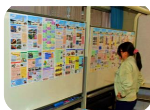
一年間分のてらす画報