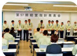
各チームから方針発表