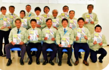
第57期経営指針発表会