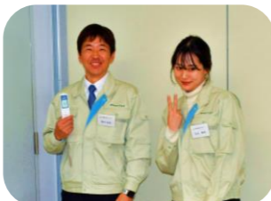
ピッ！体温を測る受付係