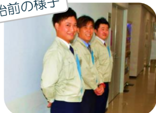
お客様をお出迎え♪