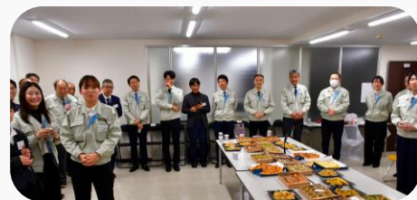
社長のお誕生日会