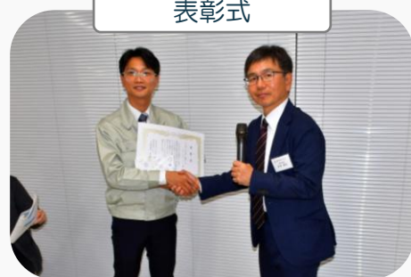
第1回握力王決定戦！

社員による熱きバトル、果たして誰が“握力王”の称号を手にすることができるでしょうか？！