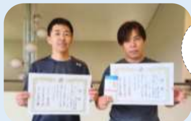
よくん トラックー