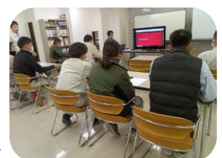
熱心に聞いているメンバー

色々なソフトがありますが、何がてらすに合っているのかを吟味しながら、検討を進めていきたいと思っております。